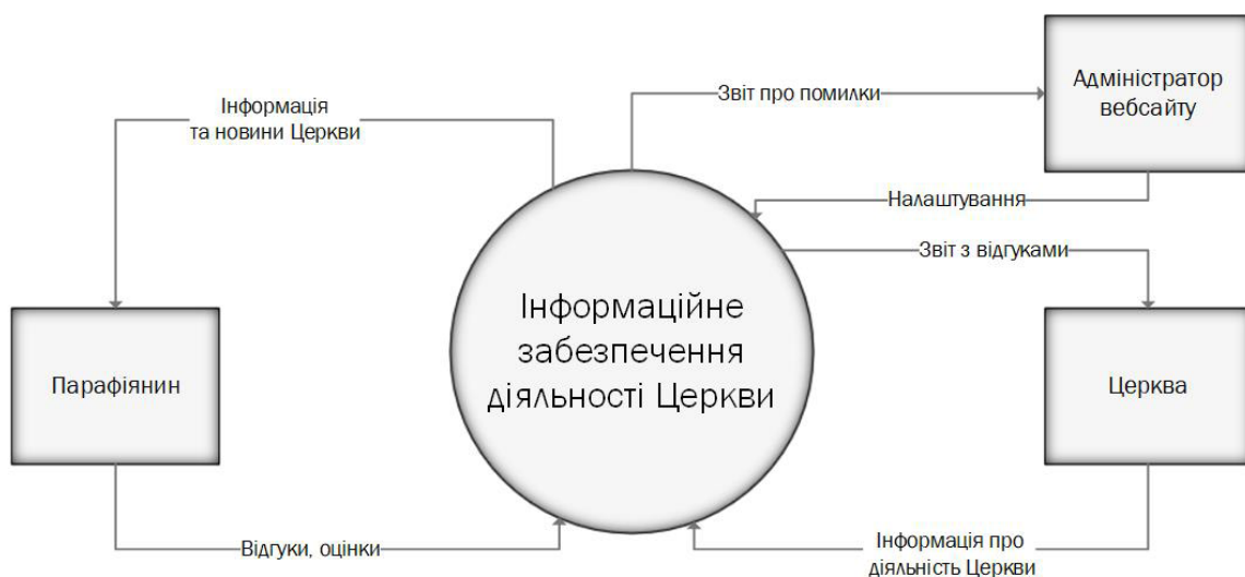
Рис. 1. Контекстна діаграма в нотації Йордана

Парафіянин-користувач повинен мати можливість переглянути на вебсайті храму такі вебсто-